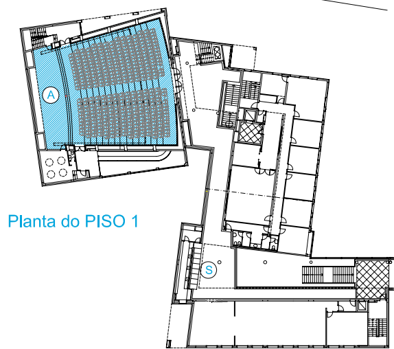
Planta do PISO 1

Os stands são construídos em placas laminadas a branco, ligadas por perfis octogonais anodizados a prata. Levarão prumos, barras de fixação, uniões, barras de travamento e frontão para colocação de identificação do expositor. Assentes em alcatifa. Instalação eléctrica. 1 mesa e 1 cadeira.