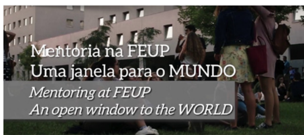
Fig.2 Fotografias sobre a Mentoria FEUP