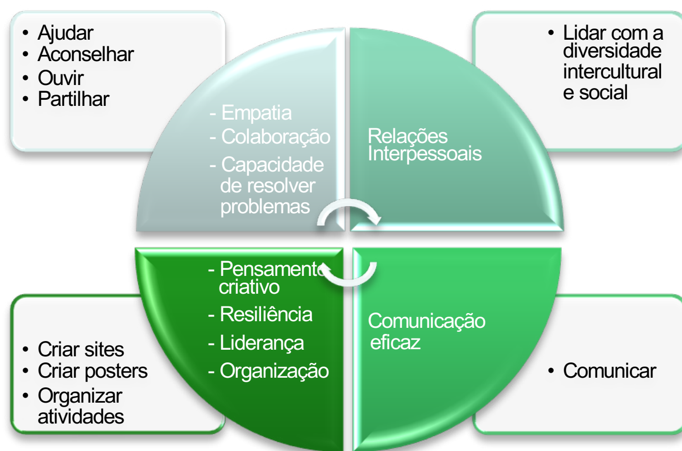
Fig.3 Soft skills versus atividades desenvolvidas na Mentoria FEUP