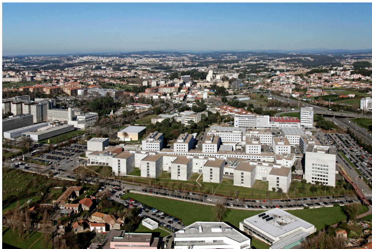
Figura 3 – Faculdade de Engenharia da Universidade do Porto – campus da Asprela (2000 -)