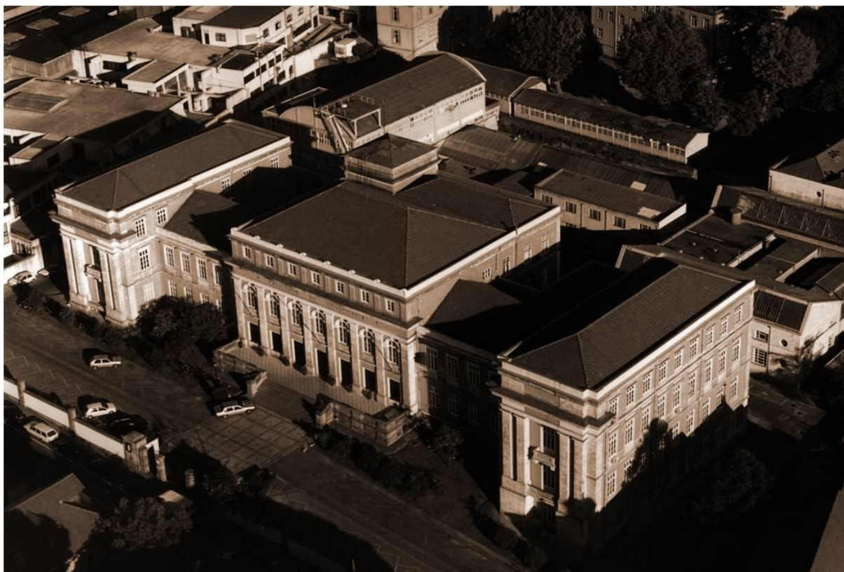
Figura 2 – Faculdade de Engenharia da Universidade do Porto – instalações da Rua dos Bragas (1937-2000)

Entretanto, a Faculdade de Ciências manteve-se no edifício original da Academia, desde a sua criação em 1911 até passar, em anos recentes e faseadamente, para novas instalações no pólo do Campo Alegre da Universidade.