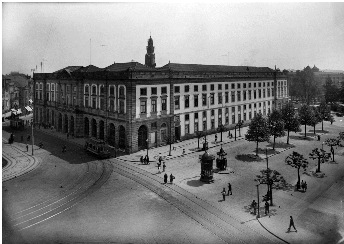
Figura 1 – Casa dos Meninos Órfãos da Cidade do Porto (1837-1937) - atual reitoria da universidade

O principal edifício da Academia Politécnica foi, desde a sua criação, a ‘Casa dos Meninos Órfãos da Cidade do Porto’ (Fig. 1), atual Reitoria, instalações que estiveram em remodelação durante várias décadas do Séc. XIX, e que foram partilhadas em vários momentos com outras instituições - a Escola Industrial, o liceu nacional, a Academia Portuense de Belas Artes, o Colégio dos Órfãos e a Biblioteca do Porto.